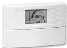
Программируемый комнатный термостат BAXI

Комнатный термостат может быть как обычным, так и программируемым. Обычный комнатный термостат позволяет установить на нем заданную температуру, которая и будет поддерживаться в помещении.