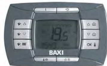
Съемная цифровая панель управления котла Luna-3 Comfort. Теперь комфорт в ваших руках!

Совместное применение в данных котлах датчика уличной температуры и датчика комнатной температуры (не комнатного термостата, а именно датчика температуры!) обеспечивает самоадаптацию котла. То есть регулировочная кривая зависимости температуры на подаче от уличной температуры вычисляется автоматически.