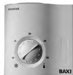
Комнатный термостат BAXI (от Siemens)

Комнатный термостат служит для того, чтобы обеспечивать в помещении постоянную заданную температуру. Он работает по принципу отключения котла при достижении нужной температуры в помещении и его включения при уменьшении температуры. Потребитель получает простое и надежное средство управления климатом в помещении.