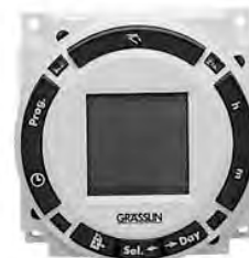
Цифровой таймер BAXI

водоснабжения (ГВС). Он служит для того, чтобы программировать режим работы системы отопления или бойлера ГВС в течение суток или недели. Таймер работает по принципу включения-отключения котла в заданное потребителем время.