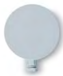
Датчик уличной температуры BAXI

Датчик уличной температуры Котел Luna-3 comfort