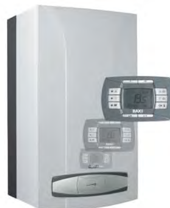
котел Luna-3 Comfort

Основная изюминка котлов серии Luna-3 Comfort - это съемная цифровая панель управления, являющаяся также и датчиком комнатной температуры. Выносная конструкция панели управления позволяет устанавливать ее в любом удобном месте.