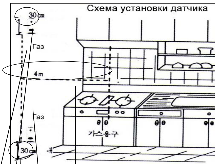
Схема установки (расположения) датчика загазованности